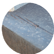
DE SITUATIE VOORAF

Zusex Renovatiecompound is verkrijgbaar in kokers of in potten als een set van 600 ml.