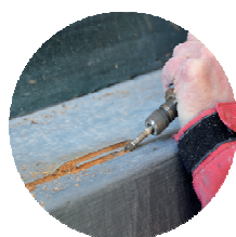
DE AANGETASTE DELEN UITFREZEN