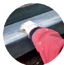
HET GEHELE VLAK SCHUREN