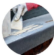
DE GEFREESDE DELEN VULLEN EN AFMESSEN